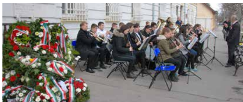
Az Ádám Jenő Általános Iskola és AMI Fanfár Előadói Együttese