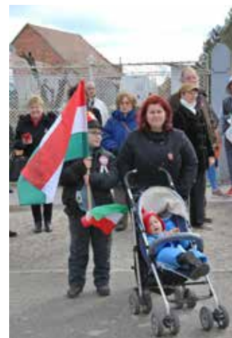
A Székely Miklós Városi Kórus előadása