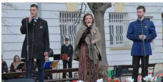
A Magyarock Dalszínház műsora